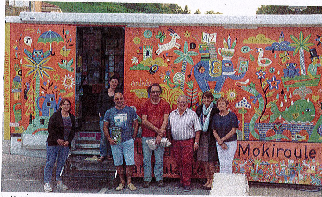
La librairie ambulante le Mokiroule était l'invité de cette manifestation dédié au jardin le mercredi 13 juin.